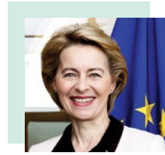
την κ. Ούρσουλα φον ντερ Λάιεν, πρόεδρο της Ευρωπαϊκής Επιτροπής