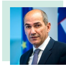
τον κ. Janez Janša, για λογαριασμό της εκ περιτροπής Προεδρίας του Συμβουλίου της Ευρωπαϊκής Ένωσης