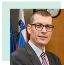
Gašper Donžan, Υφυπουργός αρμόδιος για θέματα ΕΕ της σλοβενικής Προεδρίας του Συμβουλίου