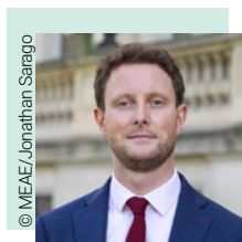
Clément Beaune, Státrúnaí Gnóthaí Eorpacha d'Uachtaránacht na Fraince ar an gComhairle