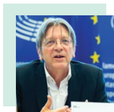
Guy Verhofstadt, Feisire de Pharlaimint na hEorpa

Faigheann an Uachtaránacht Chomhpháirteach tacaíocht ó Bhord Feidhmiúcháin , a bhfuil na trí institiúid ina gcomhchathaoirligh air.