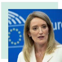
Roberta Metsola, Uachtarán Pharlaimint na hEorpa

Is faoi údarás na trí institiúid a chuirtear an Chomhdháil, a ndéanfaidh na daoine seo a leanas ionadaíocht orthu