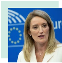
Roberta Metsola, die Präsidentin des Europäischen Parlaments

Die Konferenz findet unter dem gemeinsamen Vorsitz der drei EU-Organe statt, die jeweils durch