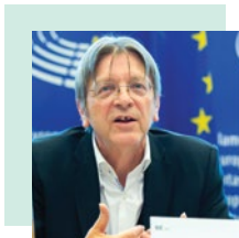
Guy Verhofstadt, Mitglied des Europäischen Parlaments

Der gemeinsame Vorsitz wird von einem Exekutivausschuss unterstützt, dessen Vorsitz ebenfalls gemeinsam von den drei Organen geführt wird: